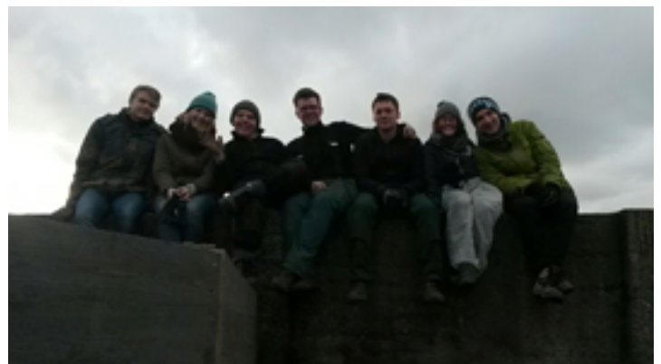
Die Crew unseres Arbeitseinsatzes auf der Lotseninsel

Um des zu verbessern musste irgendeine Art der Schalldämpfung her. Glücklicherweise hatten wir im Tischlerschuppen auf der Insel noch alte Holzwoleplatten liegen. Diese eigneten sich hervorragend, da sie leicht an der Wand anzubringen waren, den Schall dämpfen würden, und zusätzlich noch bemalt werden konnten. So bleibt auch die weiße Wand für eventuelle Folgeprojekte erhalten, ohne dass man alles noch mal nachmalern müsste.