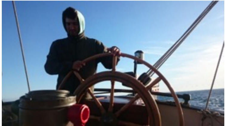
Beim Klimasailtörn am Steuer der „Neerlandia“