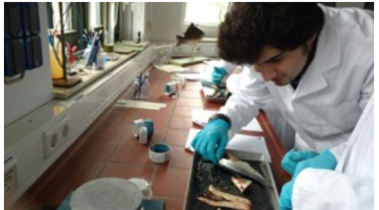
In der Forschungswerkstatt beim Fische sezieren

In der Forschungswerkstatt habe ich weiterhin einige Schulklassen beim Fische sezieren betreut, vorwiegend die jüngeren Klassen. Außerdem habe ich die Forschungswerkstatt bei Projekten wie der Kinderuni und dem Ozeantag unterstützt. Die Kinderuni war eine Vortragsreihe von fünf wissenschaftlichen aber für Kinder aufbereiteten Vorträgen. Nachmittags berichteten Forscher und Professoren der CAU an fünf verschiedenen Tagen aus ihrem Forscheralltag. Diese Vorträge waren für Grundschul Kinder von der 3. bis zur 5. Klasse gedacht. Am weltweiten