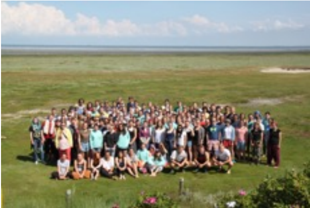
Gruppenfoto auf dem Abschlusssseminar

Gruppe und nicht in unserer gelben Seminargruppe zusammengekommen sind. Auch wenn wir teils zu wenig teils zu viel Wind hatten, hatten wir trotzdem eine coole Zeit mit vielen neuen Leuten. Gerade beim Segelseminar konnten wir nicht sehr viel Inhalt machen, da wir viel mit Segeln und Seekrankheit beschäftigt waren. Die Balance zwischen Inhalt und Zeit die wir mit den anderen FÖJlern verbringen konnten hat mir bei den Seminaren aber immer gut gefallen.